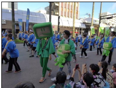
【イータ君だぁ♥子ども達に大人気。アイドル的ゆるキャラの可愛さ(笑)】