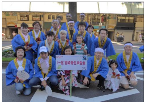
【青いハッピーが鮮やかです☆】

夏本番！青申会の夏といえば…ハイ！毎年恒例のえねこっちゃんやぎき『市民総おどり』ですネ。総勢75名の踊り隊は今年も観客を魅了します♪10回目の参加となり踊りはベテランです☆体力的には…(・・;)暑さとの戦いもありヘトヘト。今年のスローガンは『鞆 WADACHI』青色申告会の足跡も多くの観客に残してきました。