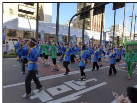
【税務署とのコラボも8年目となりました。息の合った踊りは圧巻！】